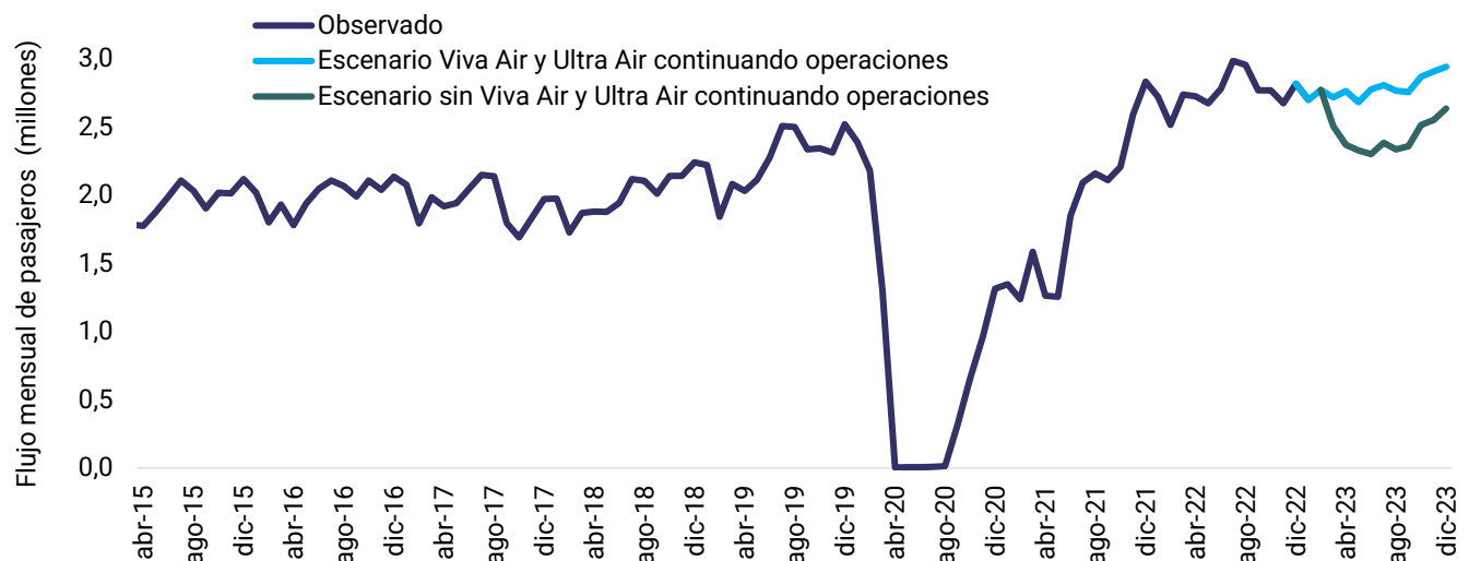
Gráfico 1. Movimiento mensual de pasajeros a nivel nacional